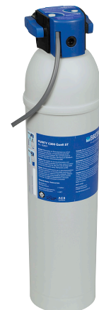
PURITY C 300 Quell ST 4.000 liter