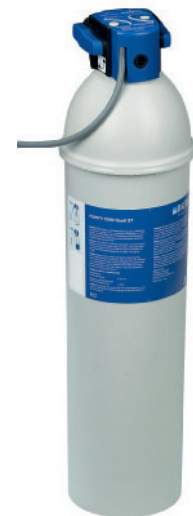
PURITY C 500 Quell ST 6.800 liter